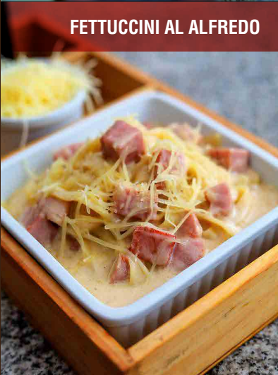
FETTUCINI AL ALFREDO