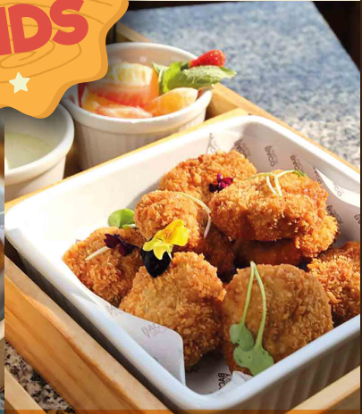
NUGGETS C/ PAPAS FRITAS